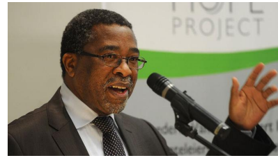
Politieke ontleder, Moeletsi Mbeki

“This is not about land. It is about the loss of votes by the ANC and its little son, the EFF. They think they can bring back the voters who are abandoning the ANC by attacking the white population. It’s an attack on the white citizens of South Africa.”