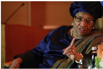
Voormalige Liberiese president, Ellen Johnson Sirleaf

"Africa is not poor, it is poorly managed."