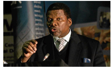
Voormalige Minister van landelike ontwikkeling en grondhervorming, Gugile Nkwinti

"People wanted money because of poverty and unemployment, but they had also become urbanised and 'de-culturised' in terms of tilling land. We no longer have a peasantry; we have wage earners now."