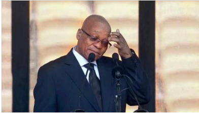
Voormalige Suid-Afrikaanse president, Jacob Zuma

"The source of poverty, inequality and unemployment is land which was taken, not bought, stolen. But the government of the people has to buy it back as if it was sold. The dispossession of land is the source of the poverty and inequality which have become the ugly hallmark of our nation and an impediment to the future of shared prosperity. Where do these people in informal settlements come from? Where is their land? Is it a lie that their land was taken?"